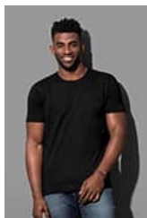
ST9400 Shawn Slub Crew Neck