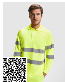
POLARIS L/S HV9306