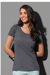
ST9110 Finest Cotton-T